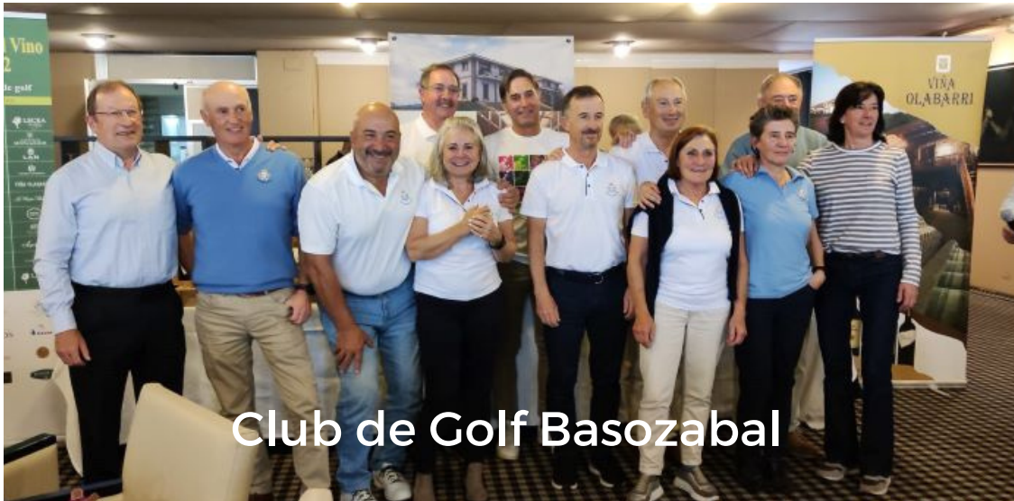
Club de Golf Basozabal

Por equipos la victoria fue a parar a tierras guipuzcoanas resultando ganador el Club de Golf Basozabal con 200 puntos, por delante del equipo local y de Rioja Alta Golf Club que alcanzaron 191 y 186 puntos respectivamente.