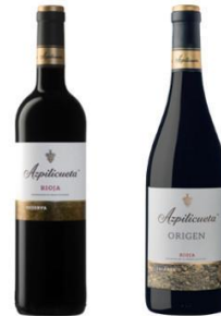
Azpilicueta Reserva y Origen Crianza