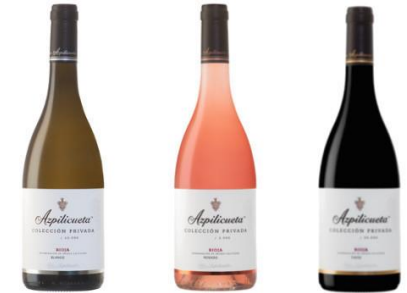
Azpilicueta Colección Privada Blanco, Rosado y Tinto