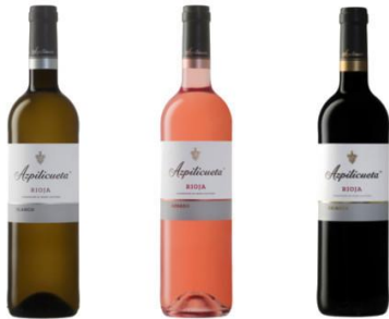
Azpilicueta Blanco, Rosado y Crianza