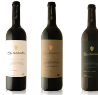
Félix Azpilicueta Crianza, Reserva y Gran Reserva